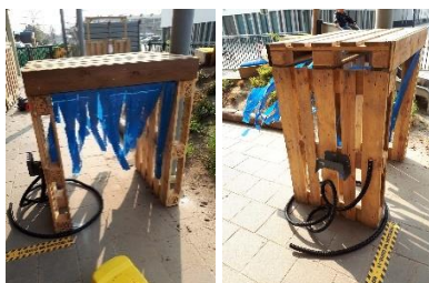
De auto-wasstraat Gooteplein.